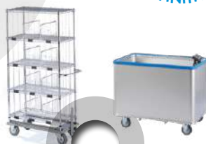
LE TRANSPORT DU LINGE